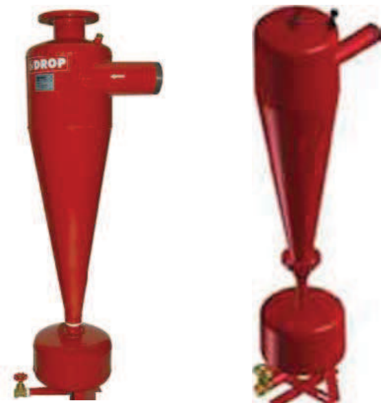
Filtro Serie "HCY" Modular 2"